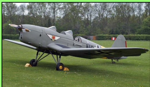
2 Sitzplätze, Motor: hängender, luftgekühlter 4-Zylinder Hirth HM504 (105 PS), Spannweite 10,40 m, Länge: 7,35 m, Leermasse = 400 kg, max. Startmasse = 705 kg, Reisegeschwindigkeit: 172 km/h, Reichweite = 800 km