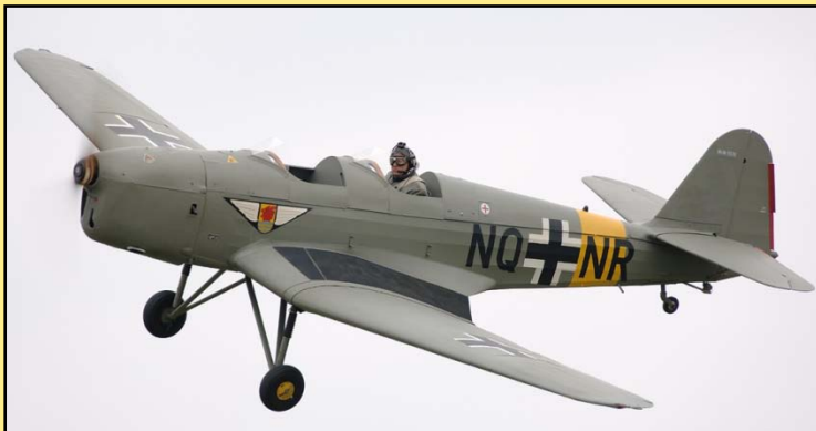
Das neue Quax-Flagschiff: Die Klemm 35D „D-EQXD“

Eine Delegation aus Spendern und Vorstand reiste Ende Januar nach Old Warden, um den Kaufvertrag für die „D-EQXD“, so die Registrierung des neuen „Quax-Flagschiffes“, zu unterschreiben.