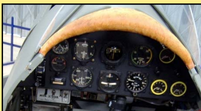
Das Cockpit: annähernd originalgetreu wie in den 40er Jahren !