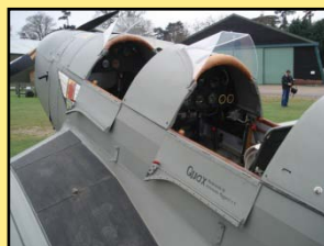
Besitzergreifend: Quax-Aufkleber ist schon drauf !